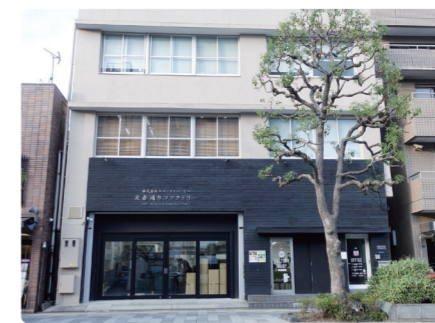
本社・北斎通りファクトリー

〒130-0014 東京都墨田区亀沢2-15-9 第1はすめビル TEL.03-6456-1691 FAX.03-6456-1692