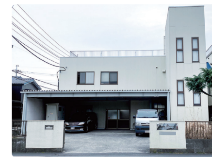
三郷シルクセンター